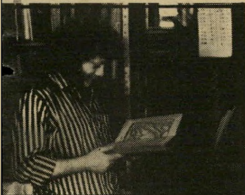
מכונות לתיקון דפים. האויב הגדול: עש