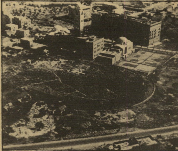
מיגרש ימקא פעם, בשנות ה-30, לא היה מיגרש כדורגל בירושלים. אגודת ימקא האוונטגית החליטה להקצות שטח ולבנות עליו מיגרש לאירועי-הספורט בעיר הקדושה.

ויצאו לנו את המרץ וישיכחו נסיונות של בריחה. גולת הכותרת היתה תמיד המישחק של נבחרת המחנה, קרי נבחרת בית"ר מכל הערים, מול נבחרת הצבא הבריטי. תמיד ניצחנו את הבריטים, בהפרשים גדולים - 3:5, 0:5, 2:5. היינו נבחרת מצויינת.