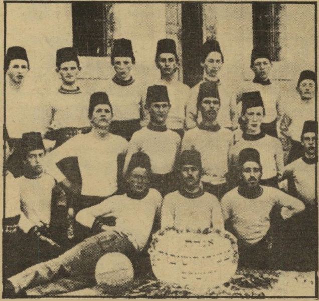
צעירי הישיבות מצטרפים למכבי (1914) - תלמידי הישיבות בירושלים ביקשו גם הם להתעסק בספורט. הם חובשים תרבושים, במקום כיפות, כמינהג התקופה.