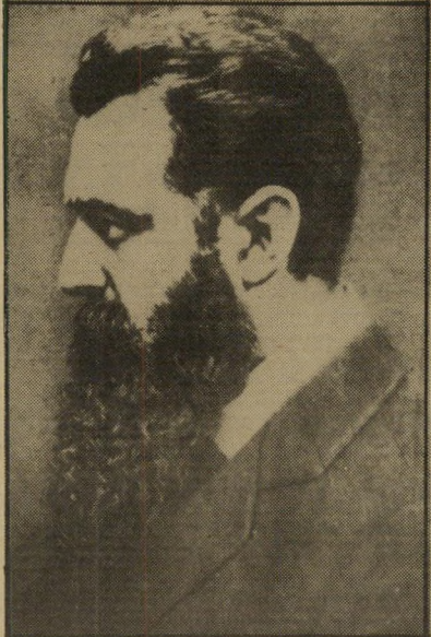
הרצל (1904) על הקיר?

עוד על גודלן של ערי הארץ (תמ"ו רורים", העולם הזה 1.6.87 ואילך). מן הראוי היה, בהזדמנות של מיסדר הגודל, להוכיח עוד שלוש ערים בארץ, שמיספר תושביי