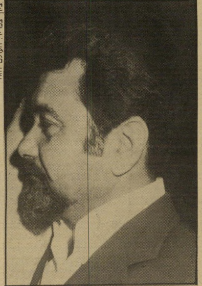
בן-אלישר (1984) מפלסטיק?

עוד ליובל העולם הזה. ברכות לאורי אבנרי ולהעולם הזה על יובלם, מוורג'יניה המערבית, אול המרינה היחידה (בין