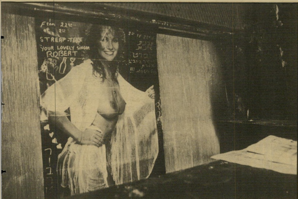
אחרי השריפה: שלט מיותרם בין ההריסות כל החשפניות באירופה רצו להופיע כאן!