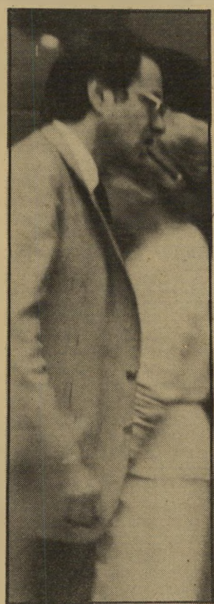
איש-עסקים גיל בציריך

חברה זרה רכשה את הבעלות על סוכנות ברונפמן. גם המוכרת היא חברה זרה. הרשומה בווארין, נציגיה בישראל ומנהלי ברונפמן הם שימרון הרין וברוך ניר. החברה הקונה מיוצגת על ידי עורכת הדין זאנים שטרואס. סוכנות ברונפמן היא הגדולה בייצוג עיתונים וזים, כיניהם בורדה הגרמני והראלד טריביון הבינלאומי.