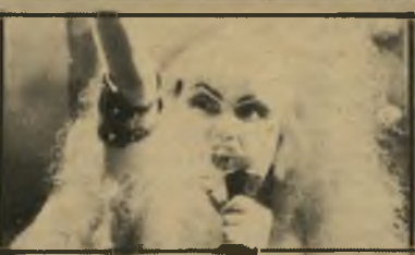
רוק כבד - הבימאית תבוא המיני של בא-כח האל עלי-אדמות. וכמובן את הכומר בעצמו. (ארצות-הברית)

בטי בני אחת הדמויות הבול-טות בקולנוע העצמאי האמ-ריקאי של שנות ה-80. הפכה בעצמה לגיבורת פולחן מסויים. דוגמת התופעה שאת המיתוס שלה היא מנסה לגנות. זוהי סאטירה על רוגדה סטמפל ועל גרוריה המישפחתיים, שכל אחד לפי עניינו מנסה לפתות את הכומר. בא כוחו של המיתוס ה"דתי שבאופנה. היא מאמינה שאפשר להגיע אל הישועה דרך הרוק הכבד, ומסבכת את בעלה ואת אחותה הסקרנית לעמוד על טיבו