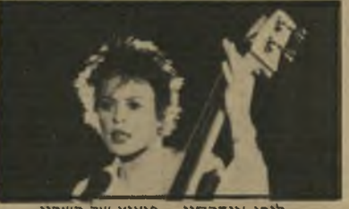
לורי אנדרסון - פיצוץ של כשרון התמונה כולה. למי שלא ראה את אנדרסון בגודל טיבעני, זוהי חובה. ולחסידי הוידאו קליפ - שיעורי-בית. (ארצות-הברית)

למעשה זו שורה מוצלחת של וידיאו קלי-פס מהופעתה של הזמרת-מלחינה-מעצבת פייטני-יפהיה לורי אנדרסון. אין ספק שזו אחת הדמויות המעניינות והמרתקות של המוסיקה המודרנית. אשיות מדליקה שיש בה מיזוג של יופי מהמם וכישרון דחוס. כל שיר הוא יצירה בפני עצמה. עם הומור מיוחד המתבטא לא רק במילים ובביצוע כי אם גם בתאורה. בתנועה ובאסתטיקה של