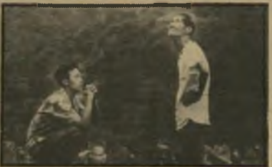
הנער וסבו - מוות במישפחה זעירים עושים את הגדולה שבחיים - דבר שכולנו יודעים, אבל רק מעטים מטיבים לבטא זאת במילים חסכוניות. (טאיוואן)

סירטו האחרון של הבימאי המוכשר מטאיוואן או סיא סייאן, בסידרת הסרטים על נעוריו, בית הוריו, ובעיקר ההשפעה של סבו וסבתו על חייו. כשתמיד מדגיש הו סיא סייאן את הקשר הדוק הקיים בין זקנים לילדים (דוגמת סירטו קיץ אצל סבא). הפעם הוא מתייחס לימי התבגרותו, כשנא-לץ לנסוע לטייפה כדי למצוא עבודה ואחר כך להתגייס לצבא. אירועים קטנים ורגעים