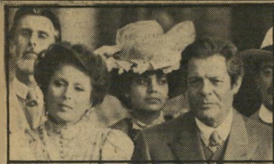
מארצ'לו מאסטרויאני וסילבנה מאנגנו - צ'כוב כבר בעבר). כשהבולט ביניהם: הגברת עם הכלב". מארצ'לו מאסטרויאני זכה בפרס ה"שחקן בפסטיבל. (איטליה-ברית-המועצות)

מן היבול האחרון של פסטיבל קאן. קור' מרודוקציה משובבת-נפש ומקסימת-עין בין ברית-המועצות לאיטליה. הבימאי, ניקיטה מיכאלקוב, נצר למישפחת סופרים ואמנים. שחקן בעצמו ואחיו של הבימאי אנדרה (ראה: אנשים מבויישים) קונצ'אלובסקי. אינו מוכר בישראל. וזו הפעם הראשונה שסרט שנחתם על-ידו מוצג כאן. גם זה עיבוד של כמה מסיפורי צ'כוב (כפי שעשה