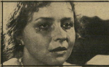
אצל ואידה - אין חדש מבחינים בתופעות שואידה ביטא טוב יור-תר בסרטים אחרים, וכאן ישנה חזרה מסור-יימת על הרעיונות האלה. (פולין)

אחד הסרטים הפחות מרתקים של אנדז'י ואידה. הניחן ביופי חיצוני בלתי רגיל. על פי נובלה של תאדאיש קובניצ'י. סיפור של רו-מיאו ויוליה פולניים על רקע פרוץ מילחמת העולם השנייה, כשלכאורה שקט ושלווה אידיליים משרתים את הפאסטורלה של גיבוריו. אבל למעשה אותות האזהרה כבר מסתננים מתחת לפני השטח. אך איש אינו רוצה להאזין להם. תחת סיפור-האהבה