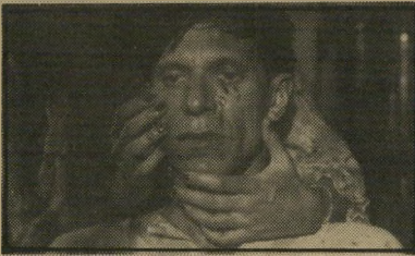
איש הרכבות מתגלח - הבדידות מופרת ואת עבודתו. ומחפש פורקן לתשוקות שאו-תן הוא מגלה בתוך עצמו בפעם הראשונה בחייו. קומדיה פיוטית קאמרית. (הולנד)

סרט הייצוג הפסטיבלי של הולנד בשנה זו נעשה על-ידי אחד מוותיקי בימאיה, יוס סטלינג. היפה שבו הוא שכמעט ואינו זקוק לכל דיאלוג, והעיקר שבו הוא האווירה המוזרה שהוא יוצר. שומר-רכבות חי לו בתום ובשלווה עם עצמו. עד שביום אחד נקלעת למקום אשה. בגלל נסיבות שונות היא נאלצת להישאר במקום כשנה, ומערי-ערת את בדידותו. הוא מניח את חובותיו