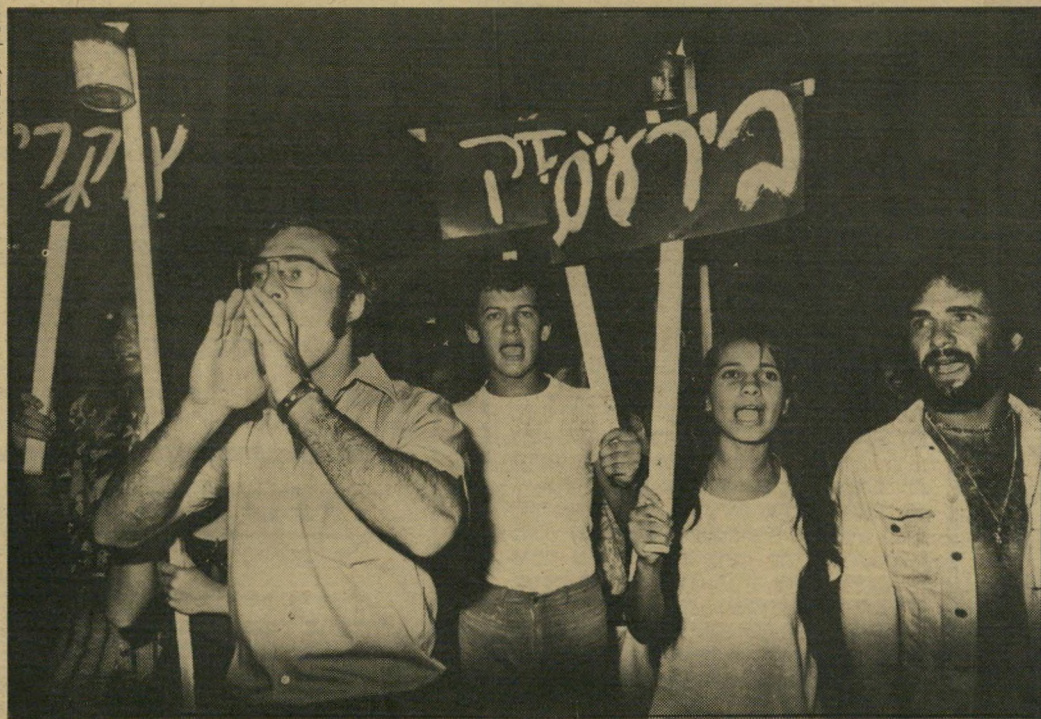
הפגנה בתל-אביב בשנים 1972-1973 נאתה ה-דרישה הציבורית להחזיר לעקורים את זכויותיהם. בתמונה: אחת ההפגנות, שנערכה בתל-אביב. מפגינים יהודים נושאים שלט ועליו הכתובת: בירעם. הפגנה אחרת צעדה ברחובות ירושלים.

את מתיים כבתי-הקברות של אבותי-היום. הם וואבות-אבותיהם, וכך הם עושים עד היום.