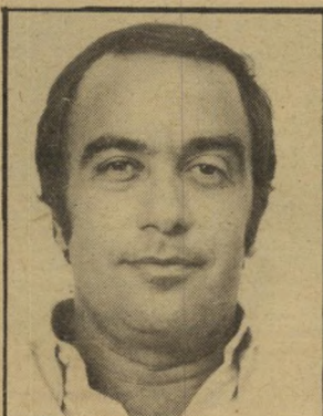
עסקן בריקמן בחיפוש ולחישות

הליגה הסתיימה. קבוצות הכדורגל עסוקות מי מהן בשמחות ומי מהן בליקוק הפצעים. השחקנים יצאו לחופ"ה קצרה, ועכשיו הגיע תורם של העסקנים. זה הזמן שלהם. עכשיו הם ינסו למשוך בחוטים. לקנות ולמכור שחקנים. להחליט מי יהיו המאמנים והמנהלים. להקים ולפורר קואליציות