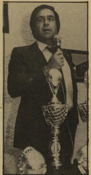
מנהל מיזרחי חצי מיליון

רה ביותר בארץ. לקבוצה מועדון או"רים גדול, המוכן לתרום עשרות ואל"פי שקלים מדי חודש בחודשו. ההוכחה האחרונה לעושרו של המועדון היא שבחוגי הכדורסל מלחשים שמכבי ניסתה לקנות את שחקן הצי האמרי"קאי ג'ק סיקמה. סיקמה, שחקן מיל"ווקי-באקס, נחשב כאחד השחקנים ה"בולטים בליגה האמריקאית. נודע ש"הנהלת מכבי, המכונה "הכספת", הצי"עה לסיקמה סכום בין שש ספרות. ליתר דיוק: חצי מיליון דולר לעונה. והכל כדי שיעבור לשחק בקבוצה ה"תל-אביבית. אך לא בחור כסיקמה ישתולל מי שימחה בגלל הצעה כזאת. הוא ענה למכבי בלאו גדול. הסיבה: הסכום הזה הצניק אותו. סיקמה, שיש לו חוזה טוב יותר במילווקי, אינו מוכן לעבור לתל"אביב בעד חופן דולרים קטן כלי-כך. עוד מלחשים על הפארקט כי מכבי תל-אביב הציעה לויילי סימס, הכושי היהודי מאליצור-נתניה, 80 אלף דולר לעונה הקרובה. בעיקבות הליכתו הסופית של מיקי ברקוביץ משורות מכבי תל-אביב, מ"חפשים מירוחי ומנהל-הכספת שחקני"חיווק רציניים, ועתה ברור שהם הול"כים שם על קאליברים ממש, ולא סתם על שחקנים ירועיים. אם הם מחפשים שחקן בשיעור קו"