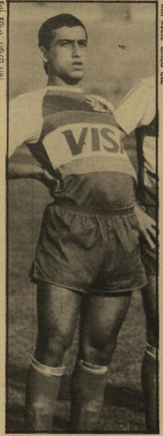
כדורגלן סיני בלי להרגיז

סיני, הקשר המחונן של הקבוצה, הודיע לא מכבר כי הוא לא ימשיך לשחק בקבוצת-האם שלו אם לנדאו לא יעזוב את הקבוצה. לנדאו היה מנו"מס יותר בהתבטאויותיו, אבל רמז כי גם הוא אינו שבע-רצון מכך שלסיני יש יותר מדי כוח בקבוצה. ראשי הפועל, החפצים ביקרם של השניים, מנסים כל העת להרגיע את הרוחות ולפשר ביניהם. השניים חשו"בים לקבוצה, בעיקר לקראת ההיער"כות לעונה הקרובה. השניים גם זוכים ביחס מיוחד בהפועל כשל השנים הרבות שאותן הקדישו למועדון התל-אביבי. עכשיו החליטו בהפועל לנקוט טק"טיקה חדשה כלפי השניים. ראשי המו"עדון החליטו להפסיק את היוזמות ל"שיות-פיוס ואת הפגישות האקראיות"כביכול שסידרו להם. הפעם החליטו במועדון לקחת פסק-זמן. בהפועל מא"מינים שרק הזמן הוא התרופה למריבה ביניהם. ובפסק-הזמן הזה דואגים ראשי הפועל שהשניים לא ייפגשו. מסת"רים סביבם בשקט-בשקט, על הבהר"נות, מאוד משתדלים שלא להרגיז או"תם — וכל זה בתקווה שעד תחילת העונה הם פשוט ישכחו את המריבה