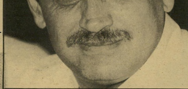
שר-מישפטים שריר צורך דחוף בשינויים

לפני שלוש שנים נהרג אה נוסף בתאונת-דרכים. השבוע התאכר עוד את. עמוס רו-מנו. הוא התגורר עם אשתו, ריטה הספי-רית, ושיבעת ילדיהם, במעברה. בכור