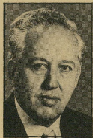
יעקובי ארטור-טור EX

מי שהחזיר את הכדור ממיגרש ה מינויים הפוליטיים לאנשי משרד-ה חוץ, לא יכול היה להתעלם ממועמ דותו של בראון — איש עתיר-נסיון וידע ביחסים עם ארצות-הברית ותחום הדיפלומטיה בכלל.