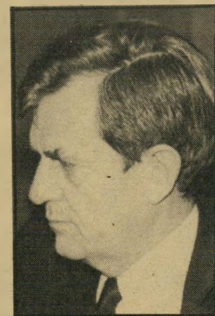
בראון השלישיה הלא-יכונה

עה או חמישה אנשים, שיכולים היו להצליח בתפקיד. היו אולי כאלה שי עלו על ארד בהיבט התיקשורתי, או באישיותם הכריזמטית, כמו אהרון יי ריב, או בנסיגם האקדמי. כמו איתמר רבינוביץ, זה לא קשור לכך שנבחר אדם מתאים."