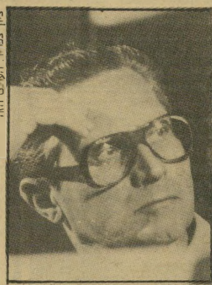
יוריב בלי דיון מישפחתי

איתרתי אותו בעת ששהה במכון וייצמן. בראון הוא דיפלומט מכף-רגל המועמרים? ובכן, הוא המועמד שעליו לעבר הזוכה המאושר, אם כי אין לאתר מילה אחת של ביקורת או אי-ברכה בי מה שאמר לי: "אני מברך אותו מקרב לב, בהחלט. מה באשר לשאר המועמרים? אני לא מוכן לומר אם הוא המועמד הטוב ביותר ביניהם, אחרת אצטיידיע למה ומרוע.