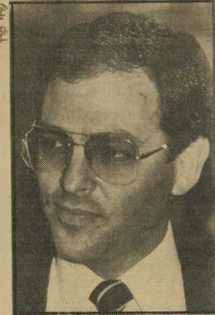
נוביק מאותה העיירה (ברומניה)

לפני כמה שבועות שהה בארץ לר- המועמרים לנשיאות מכסיקו. כמה יי מים אחרי ששב למכסיקו כדי לסיים שם את תפקידו, הוחזר במפתיע ארצה, והוקפץ לראש התור המתארך-והולך של המועמרים לנסוע לושינגטון. איתרתי את ארד — בחור נאה, ששנותיו (50) אינן ניכרות בו — כי בית-מלון ירושלמי, בעת שהממשלה רנה בעניינו.