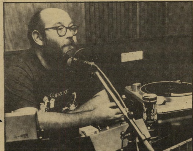
מגיש מסקין שביתות