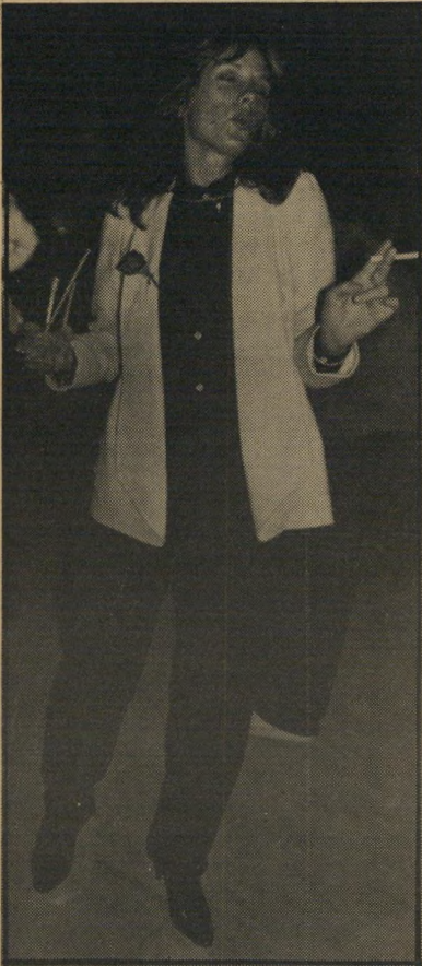
אורנה גאון — או אחרי?

מכונת הכתיבה, נשמע צילצולי טלפון ושם, על הקו, היה שפיון אחר שלי, שסיפר לי כי הגרוש הכי טרי במדינה, טדי שאולי , מחור באון אחרי אורנה גאון, והיא דווקא נענית לחיזוריו. אז אתם רוצים להגיד לי שהיא יוצאת עם שני גרושים בוזמנית? אני לא מאמינה. בזמני לא היו דברים כאלה, אבל לך תדע אצל הנוער של היום!