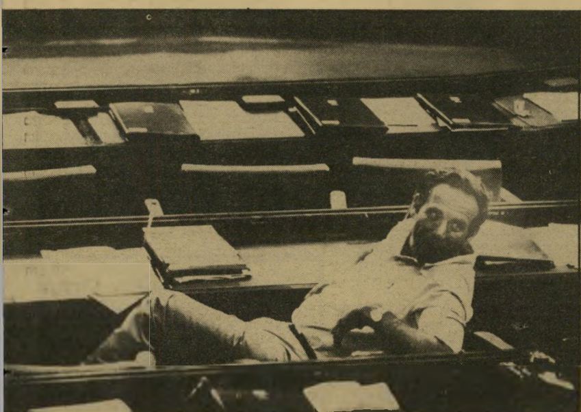
ורטהיימר בכנסת. לא הייתי עושה זאת שוב"

כל מי שרוצה, יכול לבוא לגור בכפר־הוורדים. יש שם ועדת־קבלה שדואגת שמי שבא לגור במקום יידע שאין מה לבקש ואין ממי לבקש. אין סעד או דבר רומה לזה. כל אחד צריך לדעת