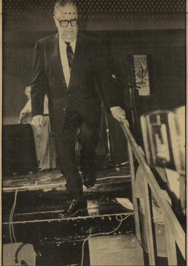
אבן צפריה העולם הזה

ואילו בוועדת-אבן קרו התקלות. יש לכך סיבה פשוטה: הכנסת כולה היא קריקטורה של הקונגרס האמריקאי, ועל כן ועדת-הכנסת היא קריקטורה של ועדת-הקונגרס. כמעט מהרגע הראשון היתה ועדת אבן לכריחה. חבריה טיילו בעולם, ולא השתתפו בישיבות. רובם לא נכחו כלל בעת שמיעת הערויות, ונאחזו בתי"רוץ השדוף שנקרא אותן כפרוטורי קול". החבר השביעי והמכריע, יוסף בורג, שהפך זומן כדיחה מהלכת על שתיים, פשוט נעלם כלא-היה. לכך נוספה בשבוע האחרון הקרי מריה של "קמפ פולארד" שמקומו דלף עוד לפני שבאו אליו חברי-הכנה"סת. ולאחר-מכן: הרפסת המסקנות כי