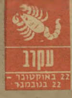
עקרב 22 באוקטובר - 22 בנובמבר