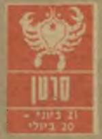
סרטן 21 ביוני - 20 ביולי