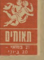
תאומים 21 במאי - 20 ביוני