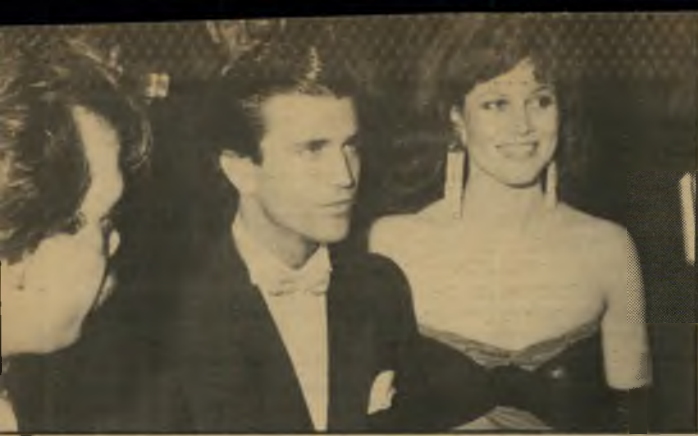
מל גיבסון (מימין) סיגורני וויורר מי?

סופרסטאר גיבסון ישב בשולחן הסמוך לנו, וציחקק ללא הרף. "למה שלא תנסו?" התעקשתי. "אם את גורמת לכך שינהל איתנו משאומתן ויוצא מכך משהו — את מקבלת קומיסיון של 100 אלף דולר!" השיחה בשולחננו המשיכה להתנהל אודות גיבסון. מדי פעם איתו עבורי את שמו בנימה של שעשוע: מאיפה זאת נחתה?