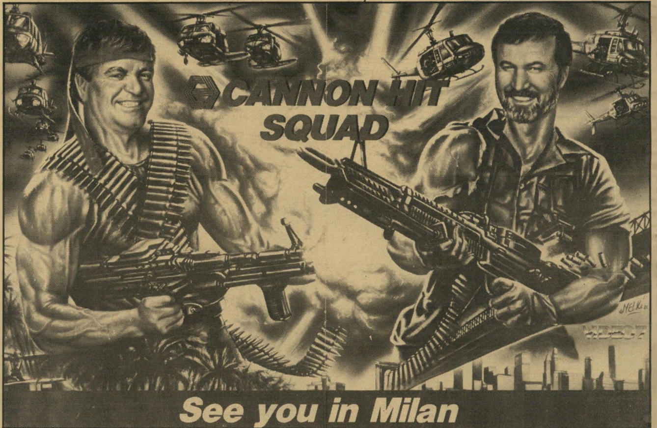
הקאנונים יורים* השנה הקשה ביותר

"יושבים שם בעלי חברתי-קנון, המשתגעים לנהל איתך משאומתן, אך חוששים שלא תדבר עימם. התערבנו כרגע בעניינך. נאמר לי שגם אני לא אצליח בכך. זהו, כל יוקרתי נתונה בידך..."