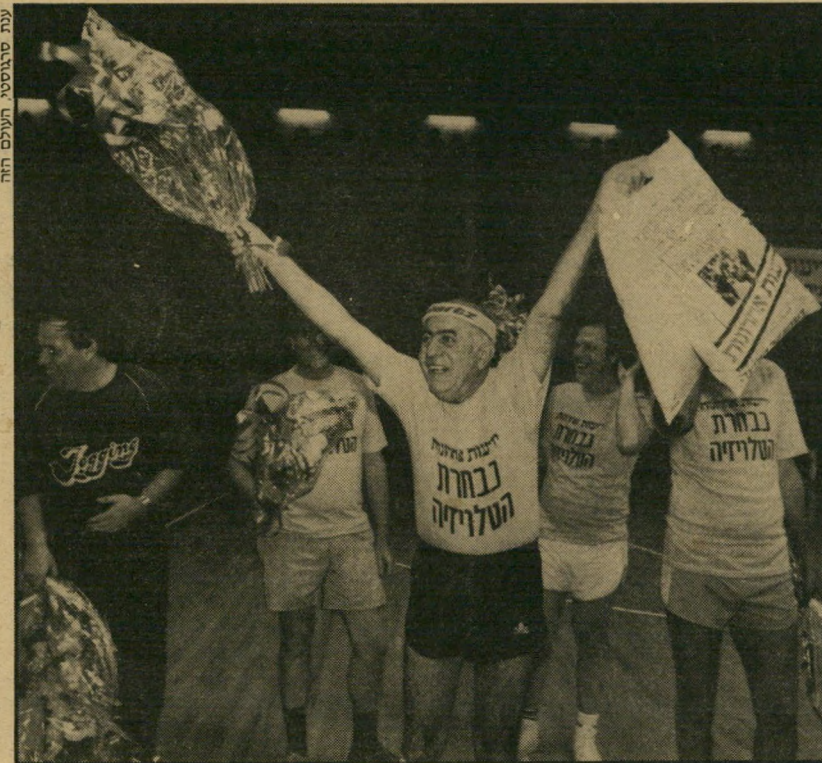
מיורחי והשקיות שתיה וטבליות נגד כאבראש