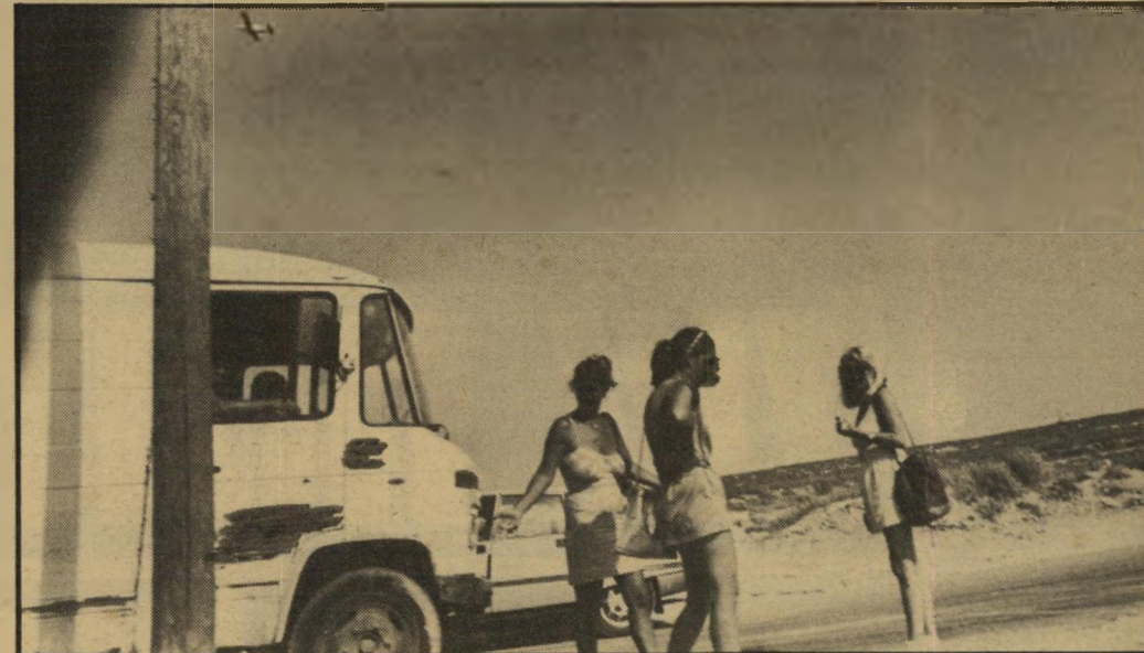
יום ולילה: אותו המקום, זונות שונות, לקוחות שונים

החום נחלש. כמה מהזונות שעמדו כאן מהבוקר נוסעות הביתה. חלקן עם לקוחות שמסיעים אותן תמורת הנחה