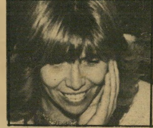
עיתונאית אתגר ש.ל.א. נכסים והשקעות