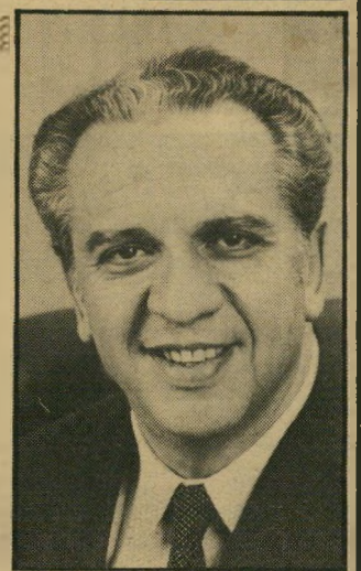
בנקאי ריקאנטי ירידה קלה

באימפריה העיסקית של מישפחת ריקאנטי יורעים על עסקיהם בישראל. אבל עסקים אלה אינם אלא הקצה הגלוי של קרחון, שרובו מוסתר מתחת לפני המים. דוגמה לכך הוא בנק דיסקונט בשווייץ, השייך כולו למישפחה. המאזן