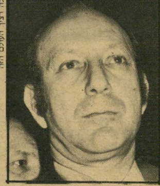
ח"כ קופמן עיני המישפחה