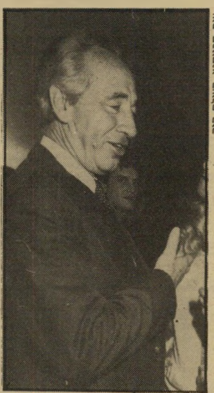
ענת טרומטר, העולם הזה

שימעון פרס דאג מאז ומתמיד להפי גיון גם חברות כלפי אבוחצירא, ובימי כהונתו כראש־משלה דאג לכלול את שמו בכל אירוע וזהר יתר או נוצץ עוד יותר. פרס סבר בוודאי שכך הוא מבטיח לעצמו את קולו של אבוחצירא כנבוא השערה, אם כי ניתוח הגיוני מוביל למסקנה שונה: קהל הבוחרים של אבוחצירא