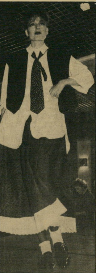
הכל הולך יחד מיכנסיים החל מ-30 ש"ח. חצאית החל מ-40 ש"ח. חולצה ב-45 ש"ח. בלי המיכנס ההדוק ועם חצאית שחורה רחבה גם שמנות יכולות. תוצרת "סווינגר".

צוא. כמעט כל שנה, את שני הצבעים הטריטוריאליים שהולכים עם כל דבר ועל כל גוף כמעט: השחור והלבן.