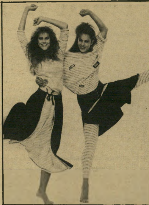
חלל לב ניבה, מערכת סריג בת 3 חל- קים - 119 ש"ח. במזג האוויר הישראלי מתאימה המערכת. בהרכב שונה. גם לקיץ.