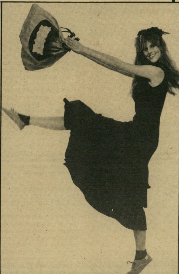
בלי כללים "ענרלה פינק" — השיר על הדעת עושה את המראה האלגאנטי.