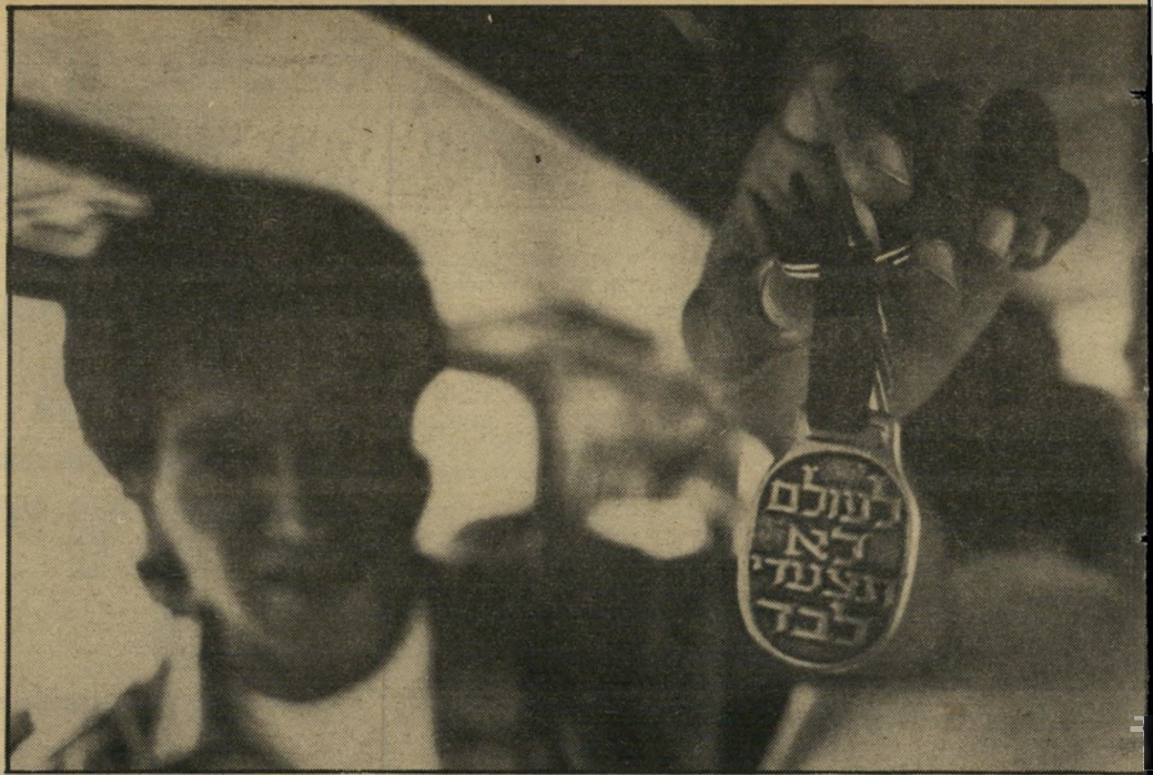
לעולם לא! אוהד שרוף של בית"ר ירוש" לים מראה מחזיק מפתחות מיוחד במינו, שמציגו האחד כתוב: "לעולם לא תצ" מיוחד במינו, שמציגו האחד כתוב: "לעולם לא תצ"