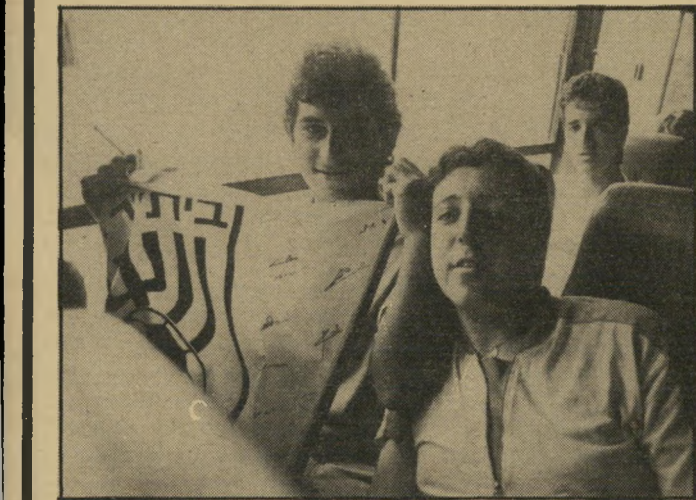
חתימות השחקנים אחד האבירים הפופולאריים ש- הביאו האוהדים היה דגל צהוב גדול, שעליו מצויירת מנורה העומדת על כדורגל, וחתימות השחקנים.