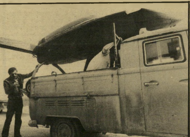
על הטנדר העמיסו המשוגעים לדרך את המטוס שהרכיבו והעבירו אותו מבין־שמן עד הרצליה. בכביש גהה. לא היה מקום לכנפיים הארוכות של המטוס - לכן עשו שתי נאגלות.

פעם הם היו נוהגים להגיד, עוד הצי שנה, עוד שלושה חודשים, עוד חודשיים". היום הם כבר לא מתחייבים לכולם. אבל בלב הם כולם חושבים על אוגוסט 1987.