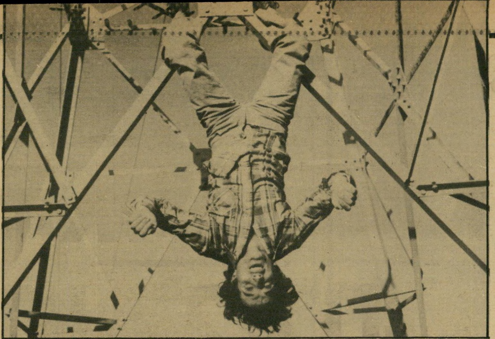
תמונה של נפסו בלבנון, והכותרת שרשם על גבה: "אני מפחד!"

אחרי-כך הכרתי לאחרונה נערה שמוצאתיין בעיניי. אני רוצה להתחתן איתה ואני מקווה שתסכים (על פי בקשת המיש" פחה אינני מפרטת את שנאמר בי יום השבת בטלפון בנקודה זו). אני רוצה לשרת את המדינה. אלוהים ג" רול.