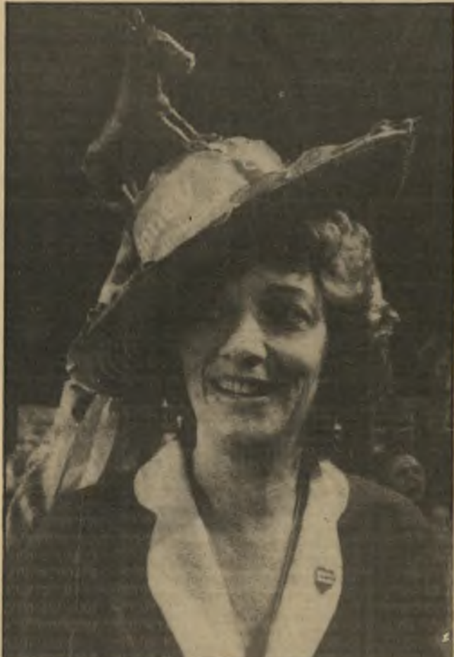
לי הארט (עם סמל המיסלגה הדמוקרטית על כובעה) "ספרי שההורים שלך הם מכרים שלי"

מאז נתון הארט בצרות. מסקרים נתגלה שמה שהרגיז את הציבור יותר מכל לא היה עצם פרשת-הניאוף, אלא מסכת-השקרים של הסנאטור. הציבור האמריקאי, בניגוד גמור לציבור הישי-