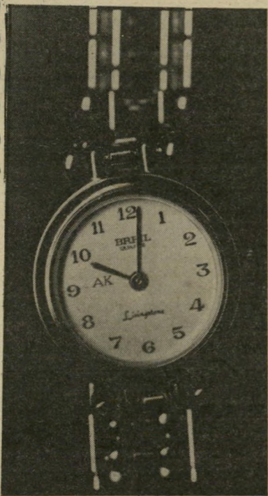
צבי טל העולם הזה