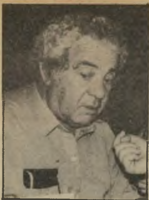
קינן "אני מברך..."

עיתונות חופשית בארץ. היום יש, ויר כול להיות שעברו מעל אורי אבנרי וטיפסו מעבר לו, אבל מה שהוא עשה והעולם הזה עשה, זה מבקריהמרינה היחידים הראוי לשמו, וזו ביקורת-המדינה היחידה לשמה. אולי הכלי היחיד שעוד מחזיק את הנשמה של הרבר שרצתה להיות מדינת-ישראל, וזה העי-תונות החופשית. ואני רוצה היום באמת, מעומק הלב ובכל הכנות, לברך את אורי ולברך את העולם הזה על התרומה שהוא תרם.