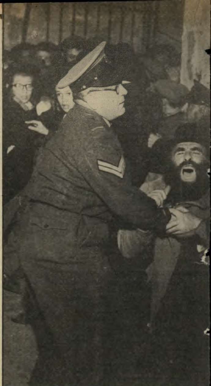
ה"50'. במיסגרת תפקידו צילם תצלומים רבים. המנציחים את ההיסטוריה של המדינה, וביניהם הפגנות השילומים בשערי-הכנסת. תמונה זו צולמה בעת הפגנה של חרדים.

היות וממה ששמעתי עד עכשיו, העולם הזה הוא ההיסטוריה של מדינת-ישראל, אני מאחל למדינת-ישראל שהיא תמשך להיות ההיסטוריה של העולם הזה. ומתברר שזה גם ההיסטוריה של העיתונות, או אני מאחל ל"עיתונות הישראלית להמשיך להיות ההיסטוריה של העולם הזה. מתברר שזה ההיסטוריה של ההומור בארץ, כי "ל אני מאחל. בעיקר מה שאני מאחל להעולם