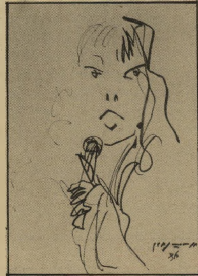
זמרת (רישום מיכחול)

נבון: אתה שואל אותי שאלות שאולי לא זה המקום והזמן לענות עליהן, בחרתי בשני מיקצור עות שנושאים. ב"ניחלוף" והנה התמדתי בהם עשרות שנים, והנה גם אתם באים לעשות לי מסיבה על חלקי בהם... כן, העיתון מציג לך דרישות, וכך גם התיאטרון. כן, היה לי עניין בדרישות האלה שהוצגו לי ועשיתי כמיטב יכולתי למלא אותן. קיימים ספרים שלי. אלה לפחות יישארו. נכון שחסרו לי דברים. אולי אני גם מצטער היום שלא השקעתי יותר בתחום התחרטי, שכליך קסם לי או. אבל חסרו לי עוד דברים בחיים. נכון גם שלא חשבתי על הנצח. אומרים עליי שאני אדם צנוע. אולי אני גם אדם יהיר.