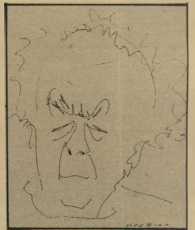
אברהם שלונסקי (רישום דיו)

שאינו מסוגל להתמכר להרכב דברים, ויש רגעים שאתה מגיע למצב של שובע. מתעורר חשש שאתה מתחיל לחזור על עצמך, הדברים מעולם לא נעו אצלי בקלות. אנשים רואים את הרישום הקל, המרפרף, וחושבים שזה כמו בא מצממו, שאין בזה שום טירחה. זה לא מרויק, האמת היא שאני לא קל עם עצמי, ואני לא קל לעבודה. אני זורק הרכה יותר עבודות ורעיונות ממה שאני מבצע או שומר.