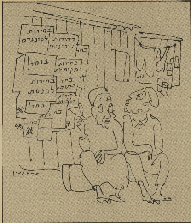
אין זה, איפוא, חלום — העגנו לארץ הבחירה" (1953)