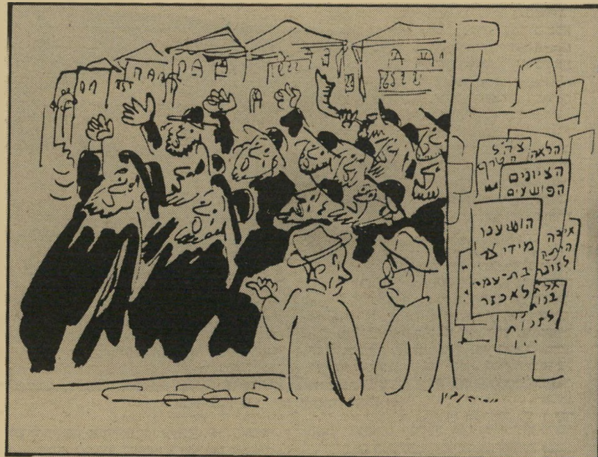
אתמול הם בכו על חורבן ירושלים. היום הם בוכים על בנין ירושלים" (1951)