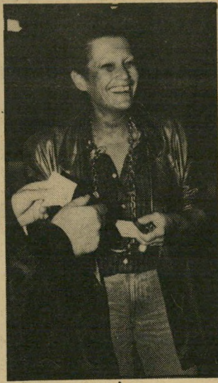
פסלת גור מתכות מיוחדות

עתיקו ייצור נוסף, לעבודות מברונזה, במחירים גבוהים יותר. לונגראוב הוא גם בעל רשת מיסע' רות מי ומי בקליפורניה. בעבר היה מושה ברובי בעל הרשת הנושאת אותו השם בישראל, שותף במחצית הבעלות בקליפורניה. לפני חמש שנים מכר את חלקו ללונגראוב, ובגלל חי' לוקידיעות הגיש נגדו תביעה על סך 200 אלף דולר. לפני חודשיים ניתן פסקדין לטובת ברובי, שפנה להליכי הוצאה לפועל. לונגראוב פנה מייד לביתי המישפט והוכיח כי לא הודיעו לו מעולם על התביעה או על הליכי השיפוט, שהתנהלו כולו בהיעדרו. השופט הורה לבטל את הליכי מימוש פסקדין ולהתחיל את המישפט מחדש, כך אשר ללונגראוב תהיה אפשרות להתגונן.