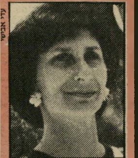
אירנה שווינסקה רומאן קצרצר

● האתלטית המולנית אירינה שווינסקה, שהיתה אלופה אולימפית ושיאנית-עור