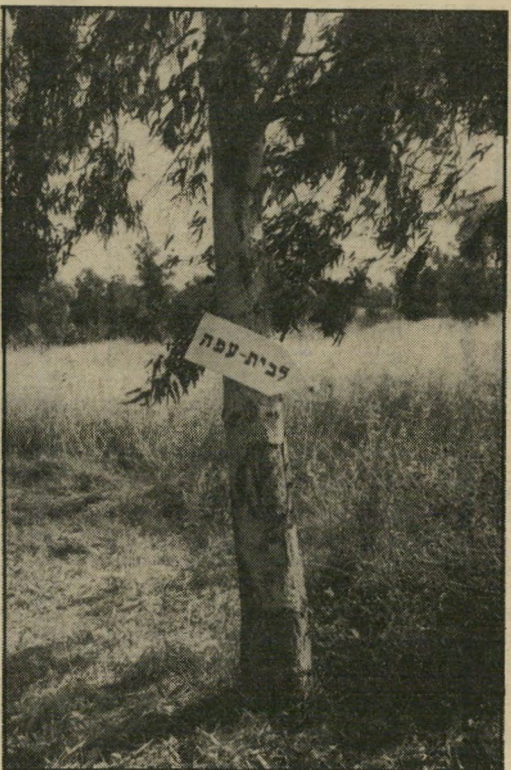
אורי אבנר, תעלים החז

באמצע הארוחה הוא ניגש אליי ואמר: "אורי, בוא רגע לשולחן שלי. יש שם איש שכדאי לך להכיר אותו."