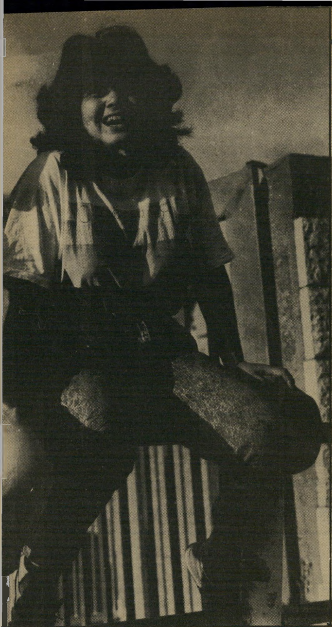
שי כיום העולם הזה