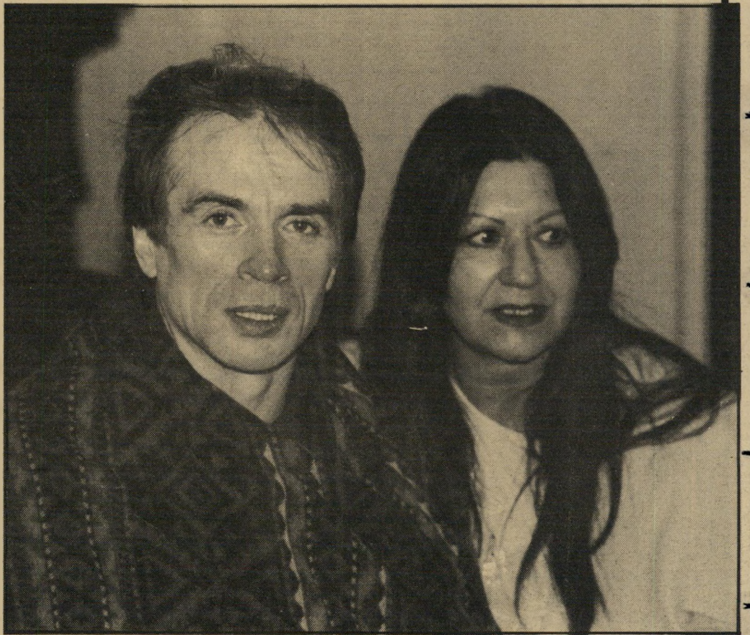
1987: נוראייב ואדווה השבוע בחיפה קודח בחום

אף אחד לא העז להתקרב לפי רודולף שהוביל לחדרו של רודולף נוראייב. הרקורן המהולל הסתגר בחדר, כשהוא קודח מחום ואינו מפסיק לקלל בשפת-אמו הרוסית. לפתע פרצה בסעי רה רמות תיאטרלית, בעלת רעמת שיער שחורה כפחם, כשהיא הודפת לצדדים את הנוכחים, ונכנסת לחדר.