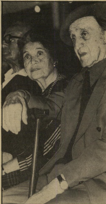
יזק-העורכים: משורר גבריאל טלפיר (גזית) ורעייתו

אחד האירועים העגומים, המשמימים, המוזרים והמתמידים ביותר מתרחש בתל-אביב, אחת לשינתיים, בחול המועד פסח. האירוע נערך על-ידי אגודת הסופרים, בין כתליו המוריהסבר של בית-הסופר, אולם כל קשר בינו לבין ציבור הסופרים הפעיל והמוכר לקוראים ולמעטניינים בספרות העברית הוא מקרי בהחלט.