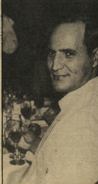
מנכ"ל אדרי ראש מועצת המנהלים

הדירקטוריון, שאינו מתערב בניהול השוטף. סולל בונה חייבת 500 מיליון דולר לבנקים, וחסרים לה 200 מיליון דולר כביטחונות. נכסי שיכון עובדים מוע' רכים ב־150 מיליון דולר, ועם המיווג תוכל שיכון עובדים לשעבד את נכסיה כביטחונות לחובות סולל בונה. הבעיה לגבי נכסים אלה היא כי מינהל-מקרקעי-ישראל, שנתן בשעתו את הנכסים לשיכון עובדים, מערער על מסירתם. דו"ח המינהל לשנת 1985 מוסר כי מטפלים בהסדר המקרקעין ששיכון עובדים קיבלה, ושלא נתנה עליהם. מדובר ב־40 עסקאות לפחות. מכאן כי ספק אם הבנקים יוכלו לקבל