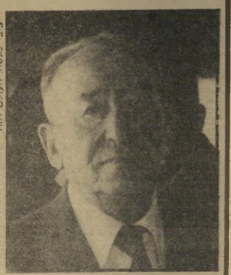
קבלן רובינשטיין להקטין חובות

ההחלטה באה אחרי שוועדת-המי' זוגים של משרד-התעשייה אישרה את מיוזג שני המיפעלים, בהתאם לחוק המיוזגים. המקנה הטבות למיפעלי-תעשייה המתמוזגים כמטרה לייעל ולשפר את הייצור. שתי החברות נמצאת בשליטת אהרון רוביני-שפיין וקבוצת לנדקו. מיפעלי מן בהרצליה מייצרים שימורי-מוזג שונים. עסיס נמצא בלב רמת-גן. חברת עסיס אחזקות היא בעלת שטח המיפעל, וכן בעלת עסיס תעשיות שהיא בעלת המיפעל עצמו. ללא השטח. עתה תנפיק מן מניות לעסיס