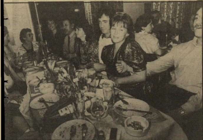
ערב נוסטלגיה ערבים כמו זה שצולם במועדון ברוסקה. וגם במועדונים ציבוריים: אוכלים, שותים וודקה ומעלים זיכרונות.

אילו היו מקימים עיר אחת, מאוכסנת רק בעולים מברית־המועצות, היה גודלה כגודל רמת־גן. מנתוני משרד־הקליטה עולה, כי כ־40 אחוזים מתושבי העיר הזאת היו אקדמאים. היו בה, בעיר הרמונית —