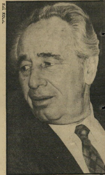
פרס חתימה בכספת

● פרס חשב שהוא מבין את הבעיות הכלכליות של ישראל. בעיניו, התשובה היא פשוטה — לעשות שלום עם הערבים, גם במחיר מסירת