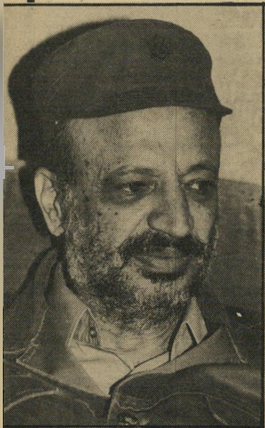
ערפאת בנק שווייצרי

עמיד לרשותו את קשריו (של חאשוגי) עם שימזון פרס, ועי רפאת הסכים לכך.