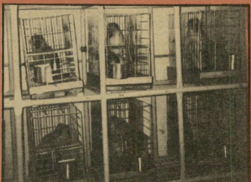
קופי ניסיונות: התעללות

אנחנו לא קבענו את הסטנדרטים. קנינו את הכלובים מוכנים. מלבד זאת, יש עלינו ביקורת של משרד-החקלאות, ויש טיפול וטרינרי צמוד, ואף אחד לא בא בטענות. (דניאלה שמי)