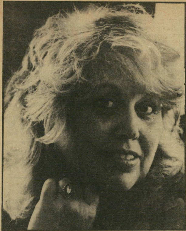
שולה ריב לא כל מה שנוצץ...

כ־6 בערב נכנסת אליי לחדר כתי הנחמדה, ושואלת אותי למה אני מבשלת על האש סיר ריק ושחור. נו, אחרי התלפוז קצרה, מים קרים, ואלריאן אחד ושני אסיוולים, הלכתי לראות מה נשאר בסיר. מה שנשאר שם, רבותיי ובכירותיי, זה יהלום מבושל שנראה יותר כמו