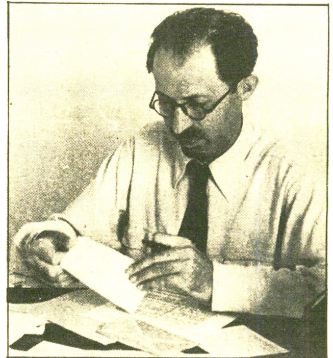
ראשימחלת מנחם בגין (1948) מבוקש בגלל פיצוץ של איזה מלון

בשלב זה אני משוכנע שזו איזו נוכלות מזויינת. לקצר את הסיפור הארוך, הם השיגו כמעט 800 אלף. למחרת פגשתי את מיקי ושאלתי אותו: "מה כל הנוכלות הזאת?" והוא אומר לי: "ג'ימי, זו לא נוכלות, הכסף הזה הוא בשביל היהודים!" ואני אומר: "מיקי, אל תבלבל לי את המוח, זה לא יקרה בחיים שאתה תיתן ל'800 אלף לחמוק בין אצבעותיך! לא במיליון שניים" אבל הוא נשבע שהכל כדון, ואני מתחיל להתפלל כיצד הוא עומד לבצע את זה.