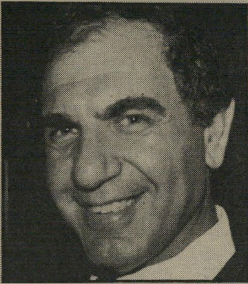
חבר הערוץ אדמון 11 ש"ח בסה"כ