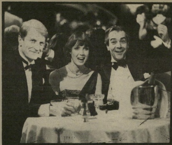
ארדיטי, אזמה, דוסוליה: פשטות מיקצועית

סיפור אהבה נואשת זו שימש למחזאי אנרי ברנשטיין כמוטיב למחזה שהוצג במאריס ב־1929, ואחרים כבר ניסוהו בקולנוע.