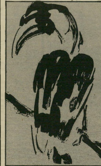
עורבא מרה: נציג האוצר

עברית. הללו התקשרו במהלך חודשי ההמתנה למימוש מסקנות הוועדה עם גורמים שונים — אגודת הסופרים התקשרה עם הוציאת הספרים "מורה ביתן" ככוננו להוציא ביחד עימה עשרה ספרים — והתחייבו בפניהם על סמך הכספים שהובטחו להם. במשרדו של עו"ד זהר, באיכות