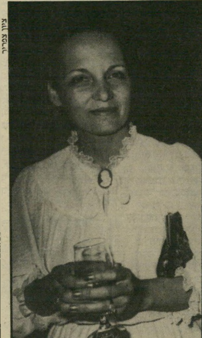
י"ר לפיד: אין לה מה להוסיף

וראה זה פלא. אמנם תשובת בג"צ, נכון לכתובת שורות אלה, עדיין לא ניתנה, אולם