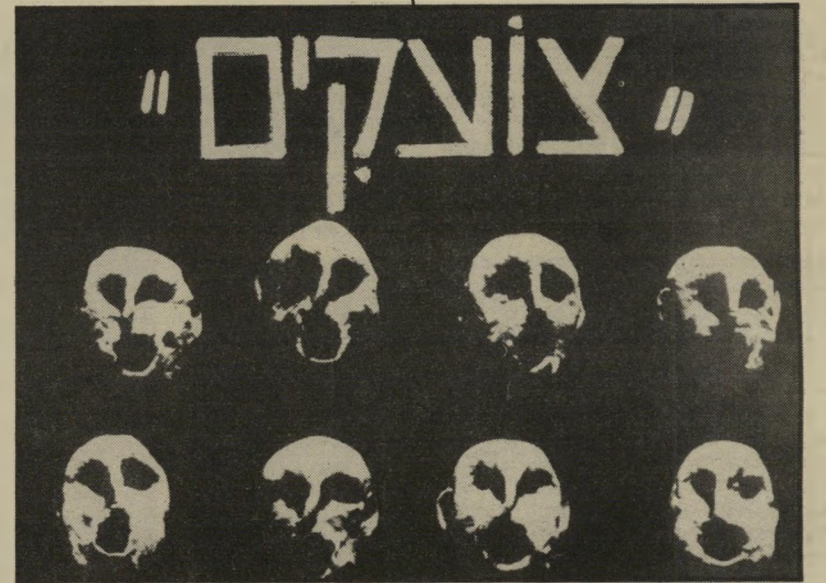
צונקים: כרוזה של ציונה שימשי

123 אלף ש"ח — תוספת תקציב לאגודת הסופרים. 78 אלף ש"ח — תמיכה במכון לתירגום ספרות עברית.