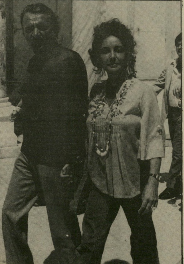
ליו טיילור וריצ'ארד ברטון צריחה היסטורית

שלמה גילה כבר אז תושיה רבה. הוא רכש מערבי תיבה לצ'יחצוה-נע' ליים, ישב מתחת לבית אביו בשכונת רחביה, וקרא בקול גדול: „מוסאיף מצחצח נעליים! מוסאיף מצחצח נע' ליים הכי טוב!“ זה לא עזר. האב המבוויש לא השי' ליים עימו. הבן זיף את גילו והתגייס לחילי-