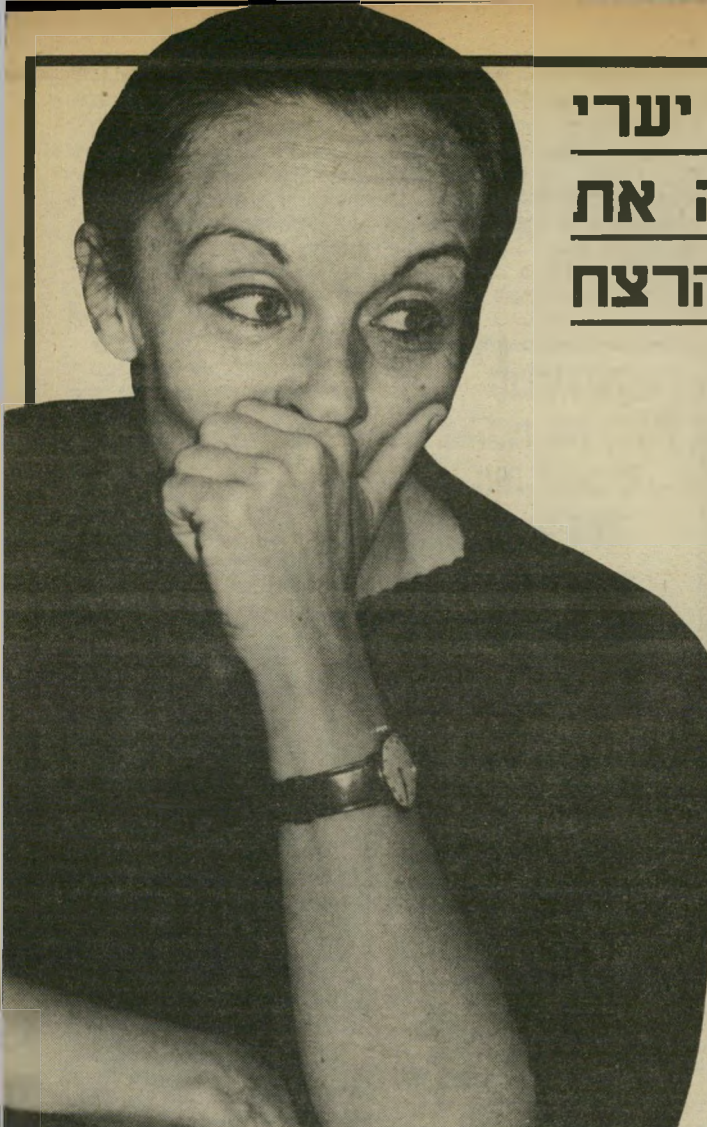
אסירה יערי גירסות בלי סוף