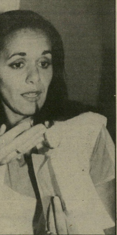
עובדת-ירווחה הראל מהתחלה

אנשי אגף-התקציבים של משרד-האוצר מבקרים ביום הרכיבי השבוע ברשות-השידור. מאז נפתחו אולפני-הרדיו החדשים בחוטי-רדיו שלם, בניין הסמוך לבניין הטלוויזיה, יש לשם