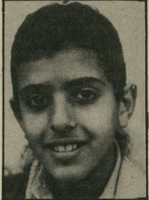
● שלום צברי, תלמיד כתיב: אני רוצה לדעת מה רמיאניוק עשה, או אני מקשיב למישפט. המורה גם דיברה על זה בכיתה, ומעניין אותי מאוד מה יהיה גוריהרין שלו. אני רוצה שיסללו אותו.