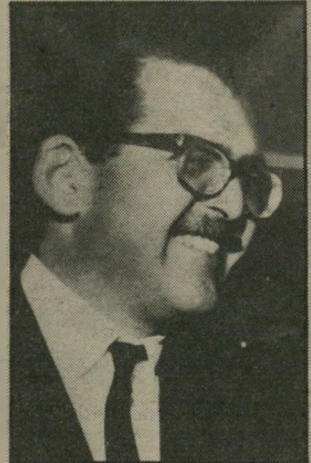
בעל־בנק רומנישילד לא הוגש כתב־אישום