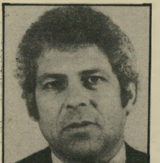
עורך־דין רווה חמישה מיליון דולר לצרכים שונים

לווה מבנק צפון אמריקה חמישה מיליון דולר לצרכים שונים, הכוללים הקמת חווה באוסטרליה, מתגורר מאז בציריך. באחרונה קיבל מעמד של תושב ציריך, דבר שמקנה לו זכות למגורים קבועים ועבודה במקום.